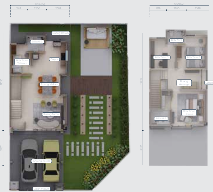
Pelan Aras Tanah Pelan Aras Satu