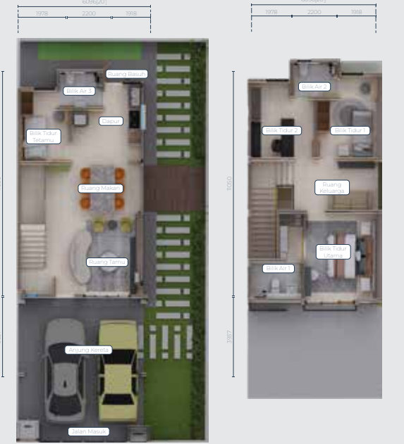
Pelan Aras Tanah Pelan Aras Satu