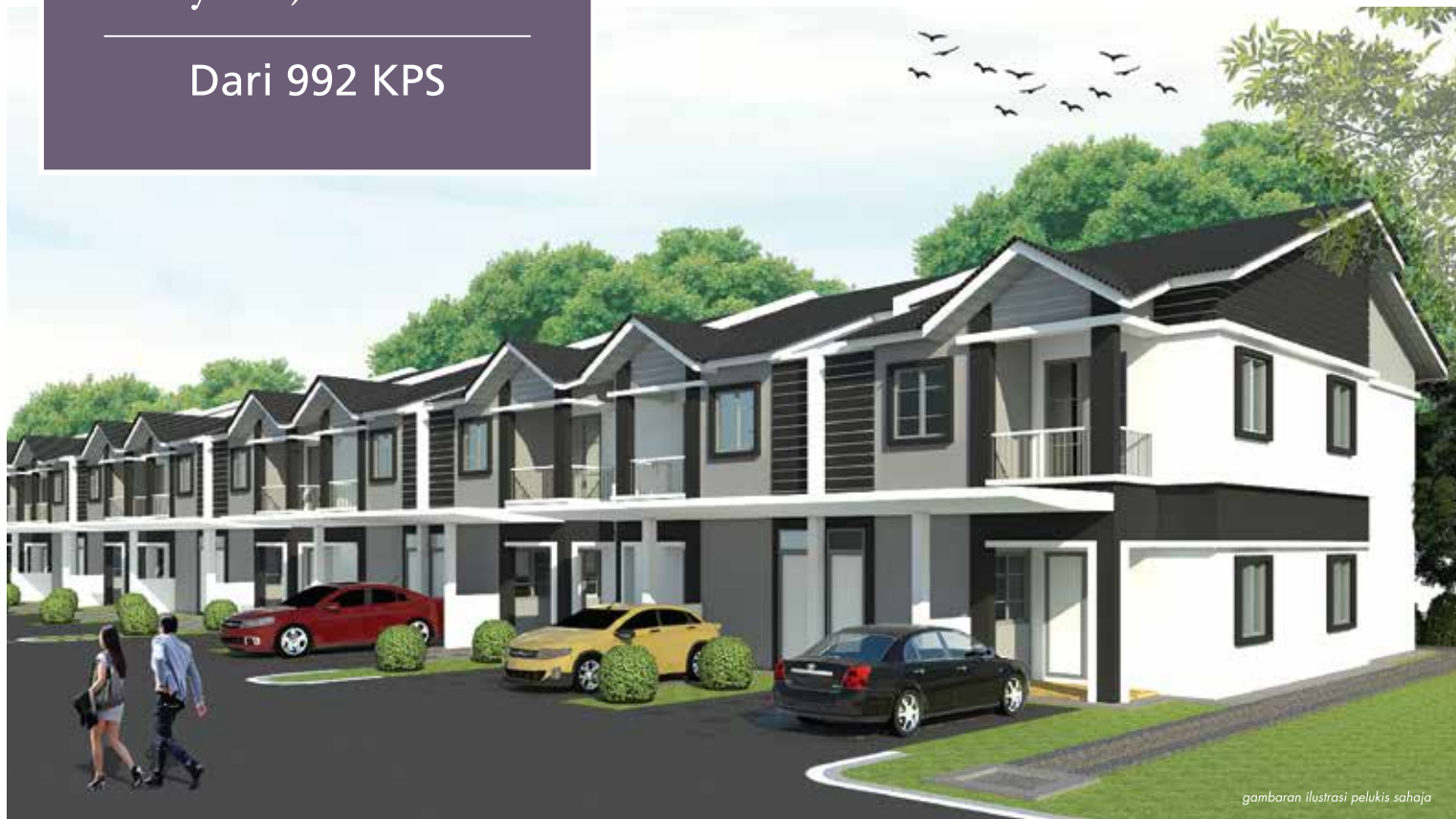
gambaran ilustrasi pelukis sahaja