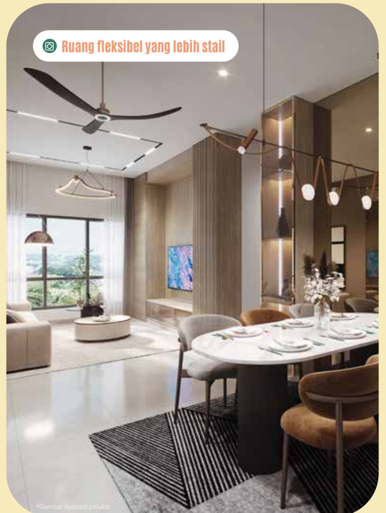
Ruang fleksibel yang lebih stail