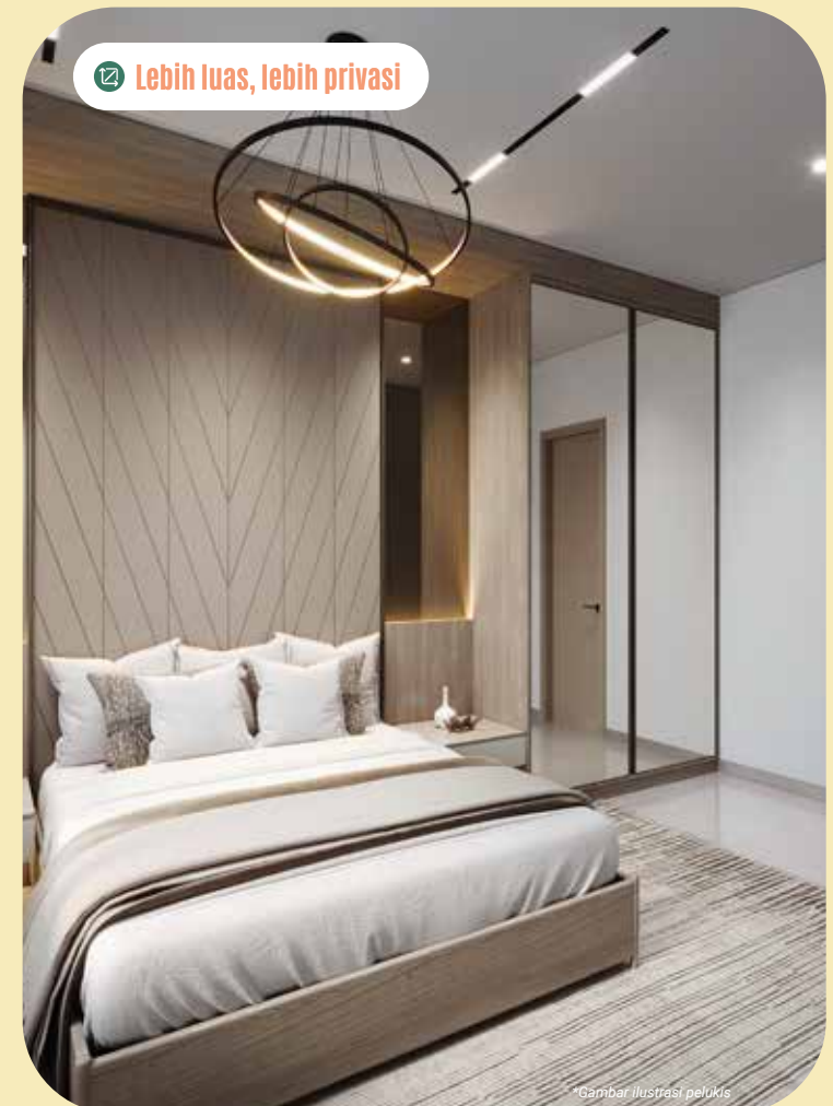
Lebih luas, lebih privasi