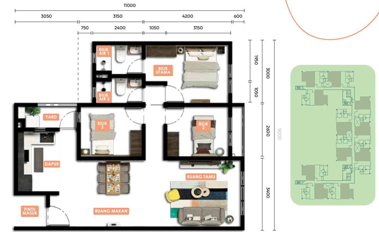
Jenis A1 906 Kps 3 Bilik Tidur, 2 Bilik Air